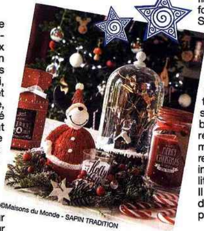
SAPIN TRADITION

En fin d'année, ce sont bien sûr les ensembles chaleureux qui remportent un franc succès. Pour les déjeuners et, a fortiori, les dîners, le rouge et le vert arrivent en tête, talonnés par l'argenté et le doré. Les premiers apportent une touche scandinave, bienvenue dans l'ambiance de Noël ! Ajoutez des touches de houx, de bois, de marron (glacé) et de pommes de pin ainsi que de baies hivernales (telles que cranberries, mais aussi cassis, prunes...). Les seconds sont généralement plébiscités pour le réveillon du 31 décembre ou le Jour